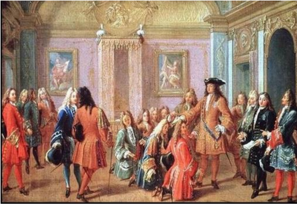
Le lever du roi