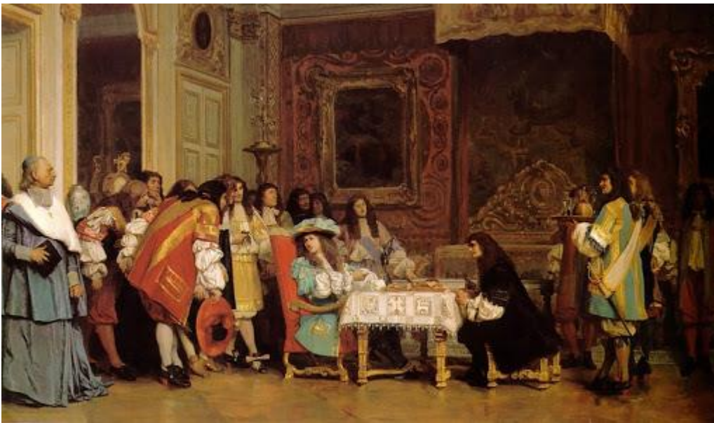
Le souper du roi.